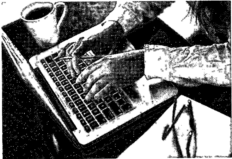
Segundo dados divulgados pelo Sebrae, foram abertas, no primeiro semestre deste ano, 2.104 novas empresas no segmento de itens usados

A pesquisa da ThreadUP também detectou que os principais varejistas de vestuário já estão planejando como potencializar esse mercado e um dos caminhos escolhidos é a formação de parcerias. Para 60% deles, por questões logísticas, a forma mais viável de alcançar